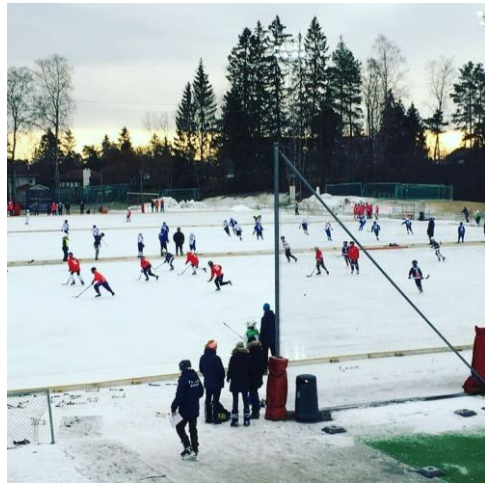
Stor aktivitet på cup!

Grobunnen for gode resultater ligger i trivsel, høy motivasjon og glede under trening og kamp. Ready Bandys klubbidé er å tilby det beste innen bandy for jenter og gutter, kvinner og menn, ledere som foreldre. Dette skal vi få til gjennom å være i forkant når det gjelder organisasjon, lederskap og spillerutvikling. Nøkkelord i denne sammenheng er Glede - Engasjement – Mestring.