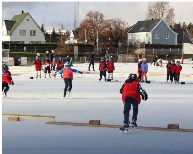
God trening under kyndig veiledning på bandyskolen

Gjennom alt dette, fra bandyskolen til A-laget, går det en «blå tråd» - en helhetlig sportsplan for hvordan vi ønsker at Ready skal spille og utvikle lag og individuelle ferdigheter. Denne blir fortløpende repetert og utviklet, og er konkretisert i form av øvelsesbanker som alle trenere og spillere i klubben kan benytte seg av. Det er også utviklet egne retningslinjer for lagorganisering.