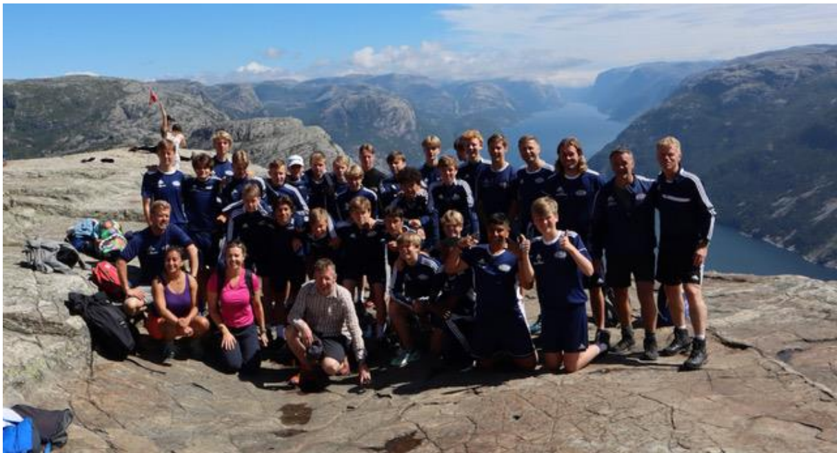
2006 gjengen på tur på Vestlandet

G15 har hatt en imponerende sesong og belønnes med opprykk til 1. div. Kanskje var det Camp Rogaland i juni som gjorde susen? Dette var en turopplevelse i Norge med treningsleir og kamper mot lokale lag i Haugesund- og Stavanger-området.