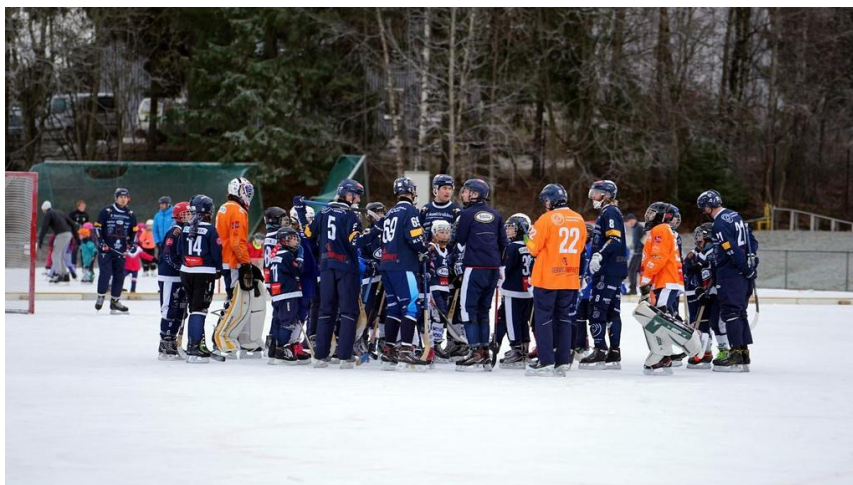
Bandyfamilien! De eldre spillerne er gode forbilder og bidrar til å sikre etterveksten.

Styret nyter godt av den jobben som gjøres fra administrasjonen, foreldre, spillere og støttespillere. Vi jobber kontinuerlig med å bli bedre, med mål om å skape gode opplevelser, utvikle mennesker med gode holdninger i et miljø preget av trivsel og trygghet. Vi vil gjerne høre fra deg om du kunne tenke deg å bidra til å realisere våre ambisjoner – enten det er i styret eller i andre funksjoner. Det finnes ingen større glede enn å engasjere seg i barnas aktiviteter!