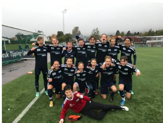
G14 vinner kvartfinalen mot Ullern i Obos Cup.

G17, G14 og G13 spilte seg alle til semifinaler i OBOS cupen.