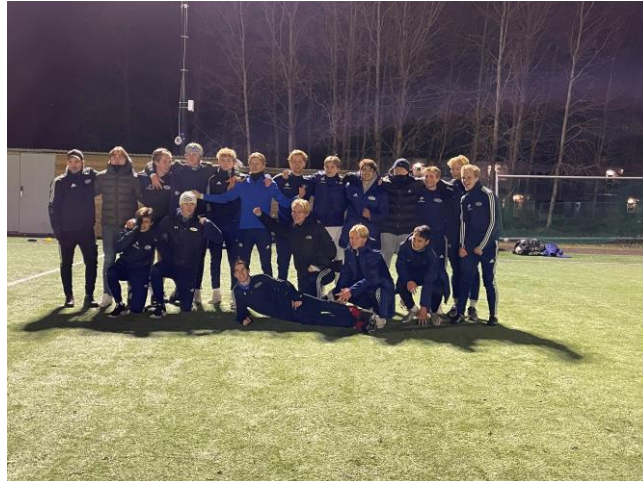
Vårt G19-1 lag

Rekordmange ungdommer har vært i aktivitet i høst og av sesongens oppturer kan nevnes G19 1 sitt opprykk, rett før seriestart fra 2. til 1. div. Laget beviste at de absolutt hørte hjemme i denne divisjonen og endte til slutt midt på tabellen.