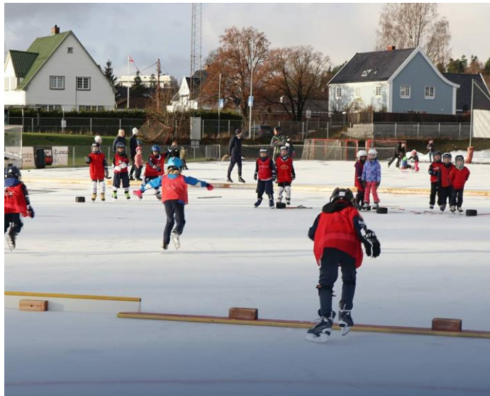
God trening under kyndig veiledning på bandyskolen

A-laget både på dame- og herresiden bidrar aktivt nedover mot de yngre lagene, i form av fadderskap, deltagelse på treninger eller som faste trenere. Det er en uvurderlig støtte og inspirasjon for våre yngre medlemmer.