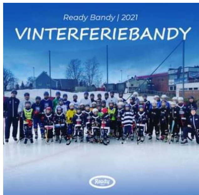
Ready bandy arrangerer flere samlinger hver sesong, med deltagere også fra andre klubber

Grobunnen for gode sportslige resultater og høyt engasjement ligger i trivsel, høy motivasjon og glede under trening og kamp. Ready Bandy's klubbidé er å tilby det beste innen bandy for jenter og gutter, kvinner og menn, ledere som foreldre. Dette skal vi få til gjennom å være i forkant når det gjelder