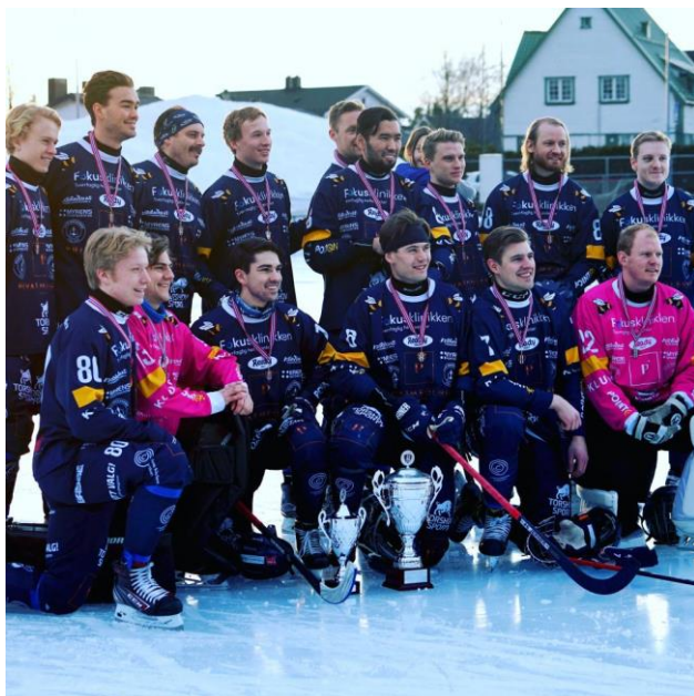
Ready bandy Herrer tok sesongen 2020/21 klubbens andre seriemesterskap i moderne tid!

Kun elitelagene på dame- og herresiden fikk unntak fra forskriftene, og fikk gjennomført halve sesonger. Herrelaget fullførte nok en meget god sesong, og tok sitt andre strake seriemesterskap. Vi gratulerer til alle involverte!